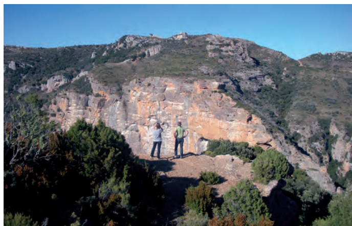
De nouveau au poteau indiquant le chemin de la Peña del Sol, pren-

Le parcours commence en haut du village de Sarsamarcuello, où l'on prendra un sentier en pente raide jusqu'à la Sierra. Le premier tronçon passe par des champs cultivés et une forêt de pins, après avoir traversé deux pistes, le sentier commence à faire des lacets pour gagner de la hauteur rapidement jusqu'au Collado Forcallo. Une fois au col, prendre la piste partant vers l'ouest et après de nombreux virages vous arriverez à une plaine où se trouve le poteau indiquant le chemin vers la Peña del Sol. Un sentier vous mènera à la Peña del Sol, d'abord en passant par des champs et ensuite par une forêt jusqu'à la crête, au fond de laquelle se trouve le sommet géodésique de la Peña et d'où vous pourrez admirer de superbes vues sur toute la dépression de l'Èbre.