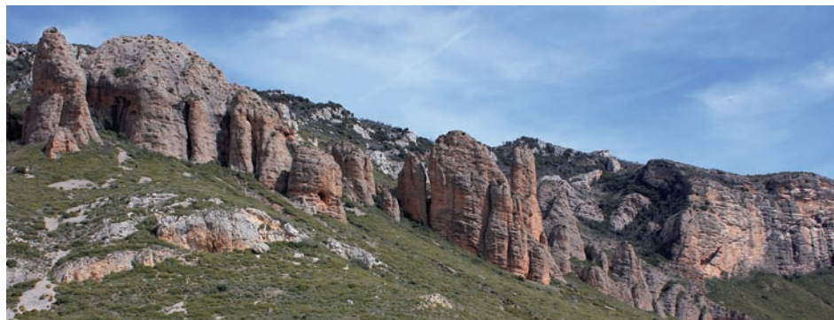
Ruta por los Mallos de Riglos (Huesca)

Se extiende a ambos lados de la cordillera pirenaica, en las Comunidades de Aragón (Huesca) y Navarra en España, y en el Valle de Ossau en Francia. Una zona de transición con una gran pluralidad de paisajes, y singulares condiciones que permiten albergar una diversidad excepcional.