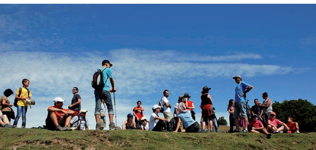
Ruta por Abodi (Navarra)