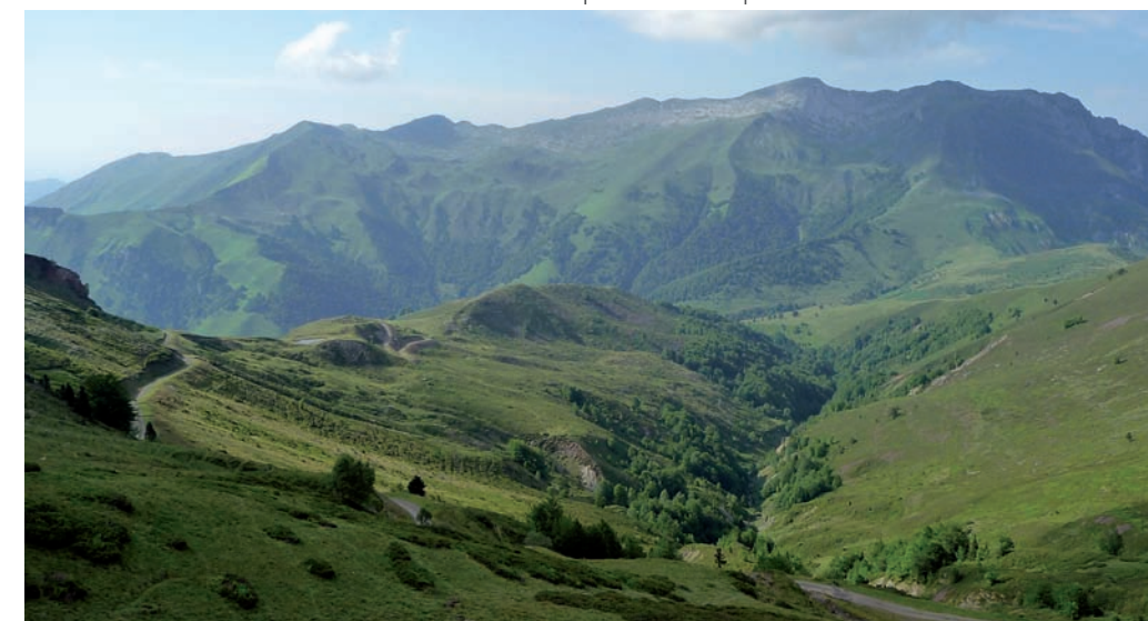
Ruta por el Col d'Aubisque: Boucle Soum de Grum. Valle de Ossau

Toda la información sobre el proyecto, sus recursos y actividades en: www.vultouris.net