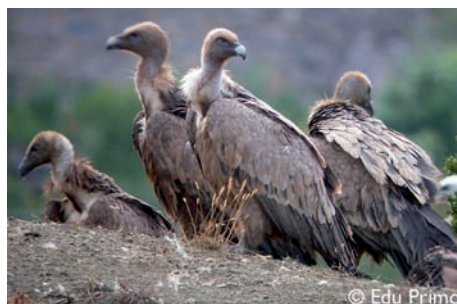
Estado de conservación de los buitres pirenaicos

Entre 2009 y 2012, los valles pirenaicos de Navarra, la comarca de la Hoya de Huesca, y el Valle de Ossau, desarrollan un proyecto de sensibilización ambiental en torno a estas especies, basado en un conjunto de recursos turísticos y educativos para todo tipo de visitantes :VULTOURIS.